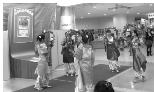
国際交流にぎわいわいわまつり(ステージ)