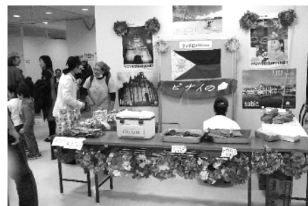
国際交流にぎわいわいわまつり(料理屋台)