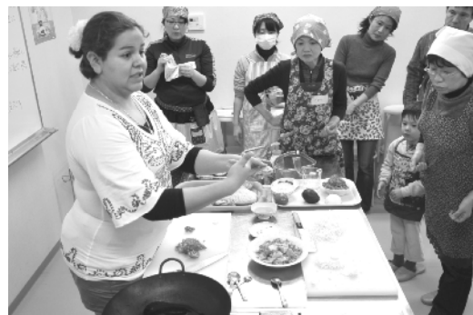
JOIN 料理交流会(メキシコ)