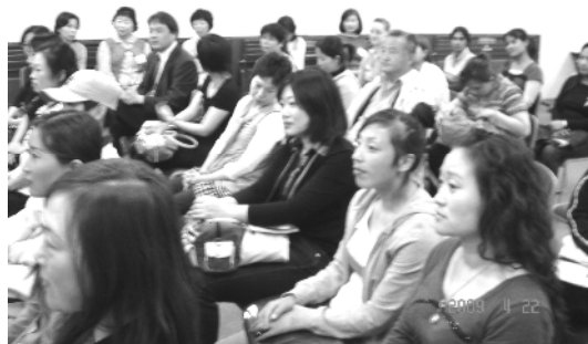
生活日本語教室(開講式)