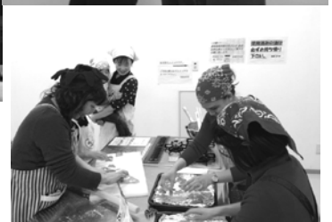
国際交流ボランティア養成講座