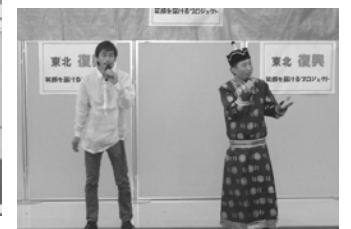
にぎわいわいわいまつり