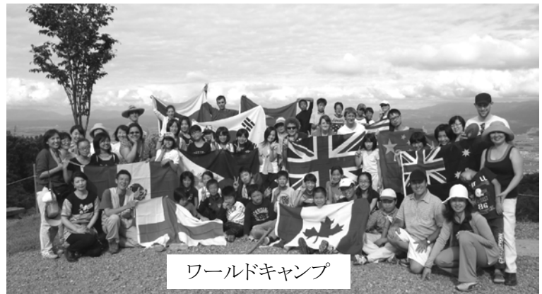
ワールドキャンプ