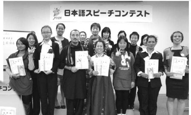
日本語スピーチコンテスト